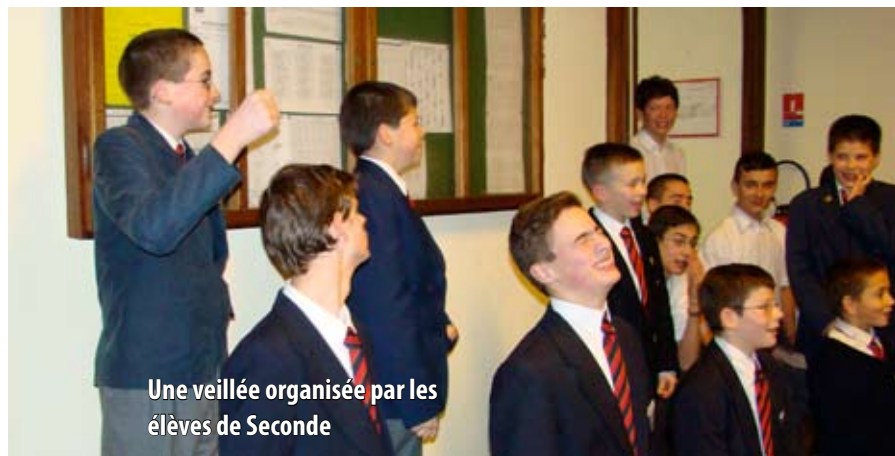
Une veillée organisée par les élèves de Seconde

La classe de Seconde est ce que l'on appelait jadis la classe des Humanités, si importantes pour préparer les esprits et les cœurs. C'est une classe tout à fait privilégiée, car c'est la dernière où ces garçons, que nous connaissons bien, et auxquels nous tenons, non pas seulement parce que ce sont eux mais parce qu'ils sont l'avenir, et l'espoir, c'est la der-