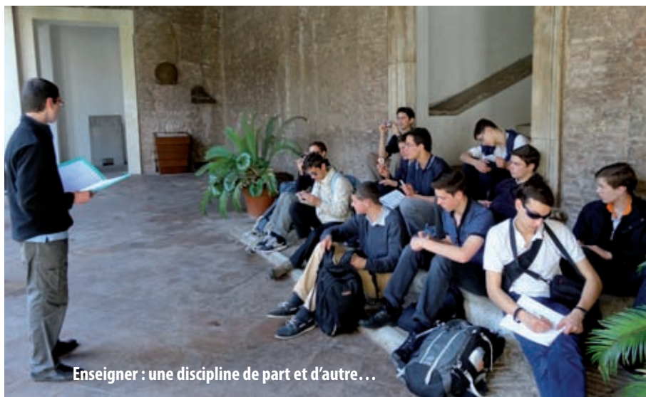
Enseigner : une discipline de part et d'autre...

Ce qui fait la différence, nous confient nos anciens, ce sont deux qualités qui vous sont propres : votre